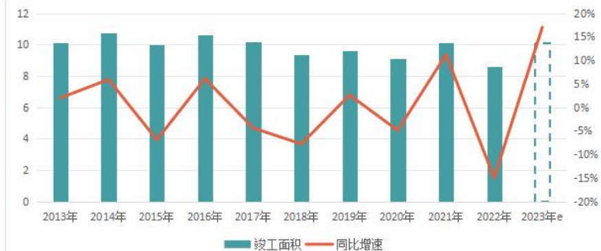
2013年-2023年房地产开发企业竣工面积及同比走势（单位：亿平方米）