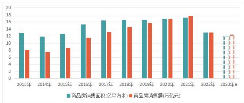
2013年-2023年商品房销售面积、金额走势（单位：亿平方米、万亿元）

2023年房地产行业规模继续下滑，据克而瑞研究中心预测，预计全年商品房销售面积、金额为11.93万亿 m^2 、12.28万亿元，分别较2022年下降8.2%和5.1%，降幅较2022年大幅收窄，行业整体维持底部震荡格局。竣工指标的表现亮眼，2023年预计竣工面积增速17%左右，由于2022年基数较低，2023年增速也是创下近十年新高。