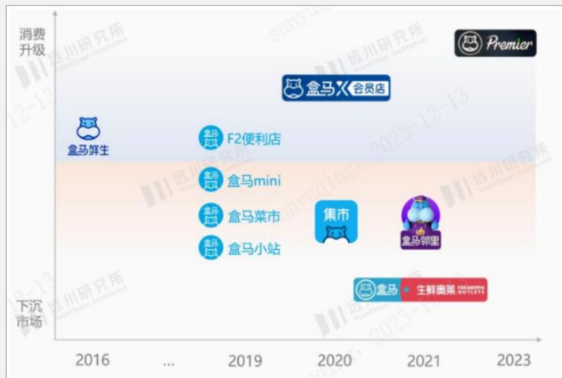
图：盒马多渠道布局历程